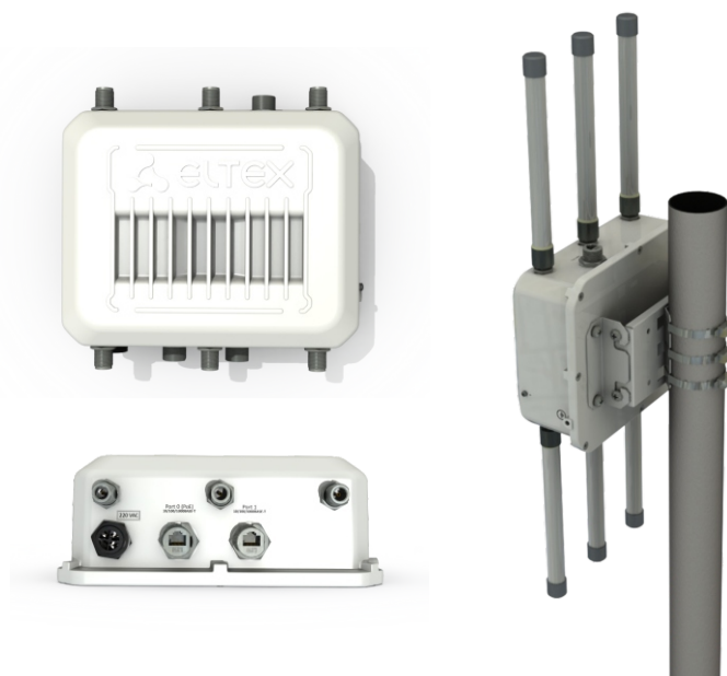
Базовая станция WOP-12ac_LR